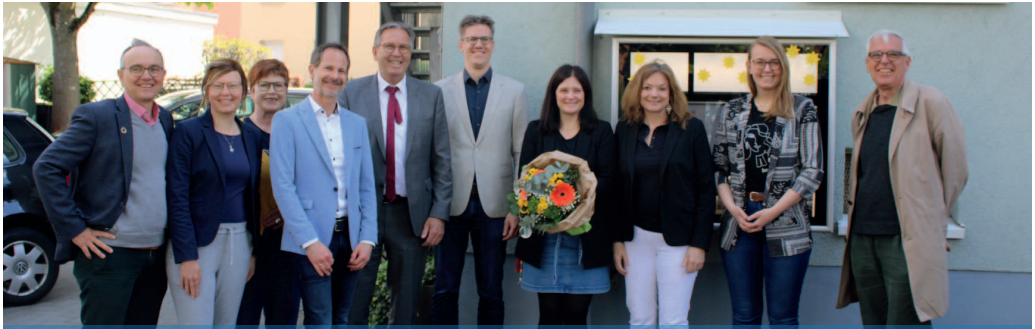
Prominente Besuche zur Einweihung der Solaranlage an der Kita Christuskirche, Mai '23