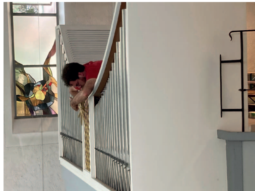
Orgelbauer bei der Montage des Zimbelsterns