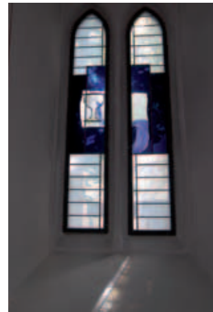
Lukaskirchenfenster Anne Hitzker-Lubin Auslaufender Kelch

Darüberhinaus fallen die Sommersonntage in die so genannte festlose Zeit im Kirchenjahr, in die viele Wochen andauernde Trinitatiszeit: Die Sonntage werden so lange als „Sonntage nach Trinitatis“ (Trinitatis ist im-