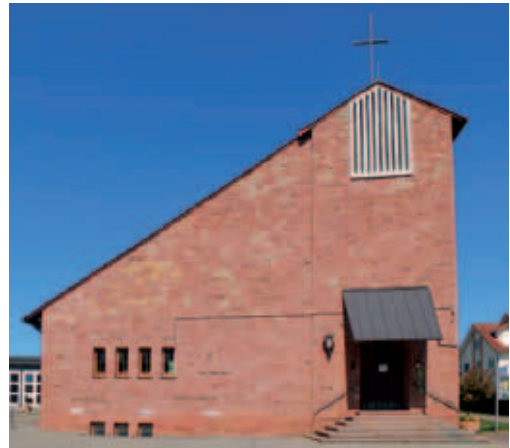
Kapelle „Vom guten Hirten“ Unterbessenbach