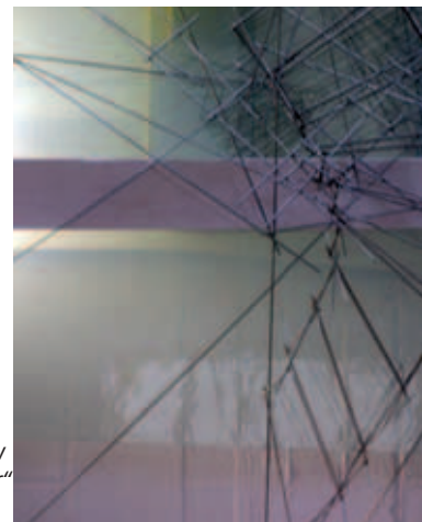
St. Jakobus Altarwandgestaltung Lukas Derow „Jakobsleiter“ (Ausschnitt)