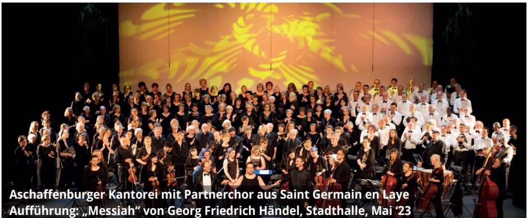
Aschaffener Kantorei mit Partnerchor aus Saint Germain en Laye Aufführung: „Messiah“ von Georg Friedrich Händel, Stadthalle, Mai '23