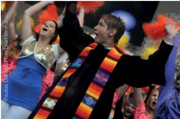
v.l.: Musik und Glaube, Jugendgruppenversion „Ein feste Burg“ – schmissig durch minimale Bearbeitung