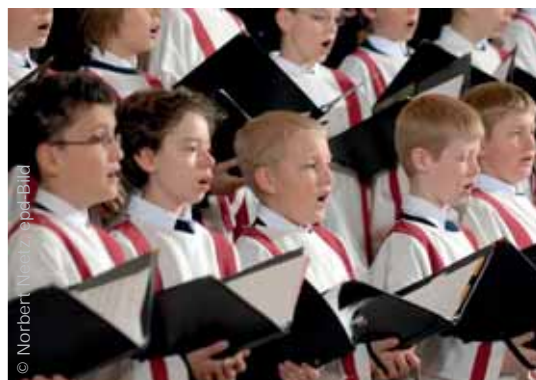
Kinder singen gern – ob im lokalen Chor (links) oder bei den Münchner Domsingknaben (rechts)