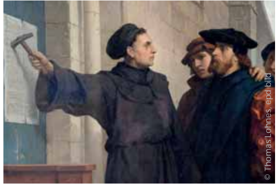
Singen stimmt heiter – sorbische Sängerrinnen (links), Thesenanschlag in der Kunst (F. Pauwel, 1872)