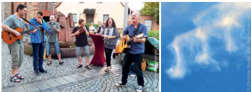
Musik auf dem Kirchplatz in Kleinostheim (links), Kirchenmusik als himmlischer Dreiklang (rechts)