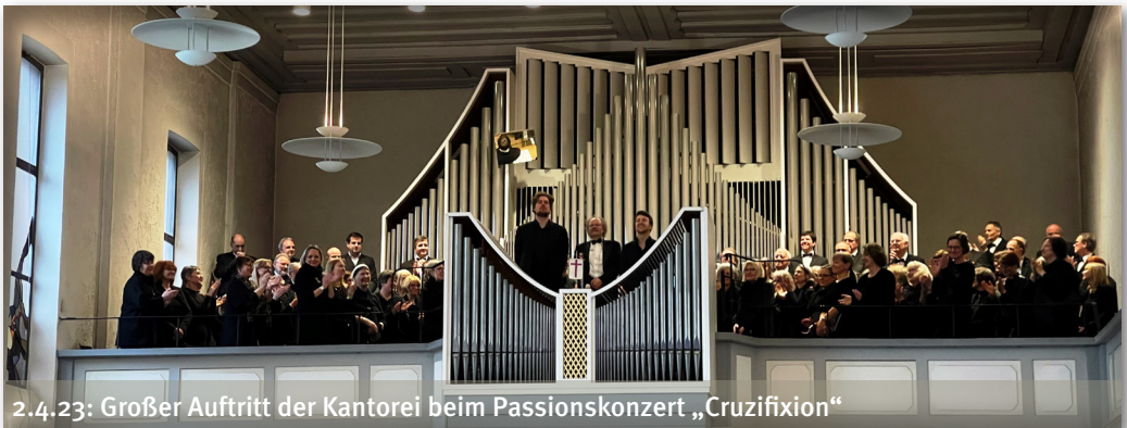
2.4.23: Großer Auftritt der Kantorei beim Passionskonzert „Cruzifixion“